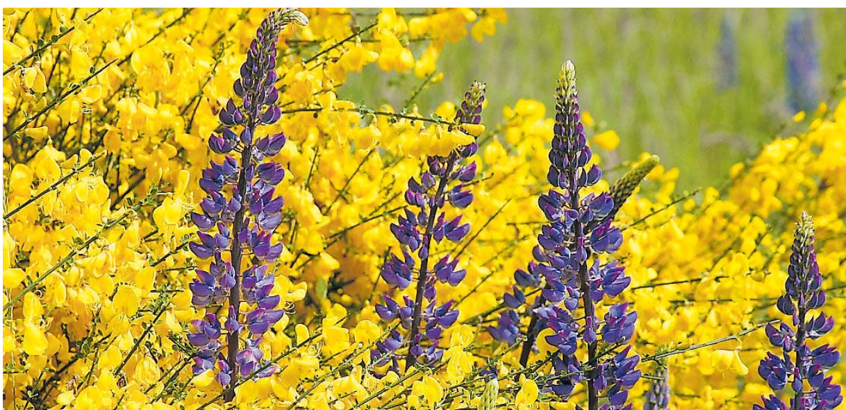
Ginster und Lupinen brachten das Foto von Wolfgang Ballof im Juni auf Platz eins.