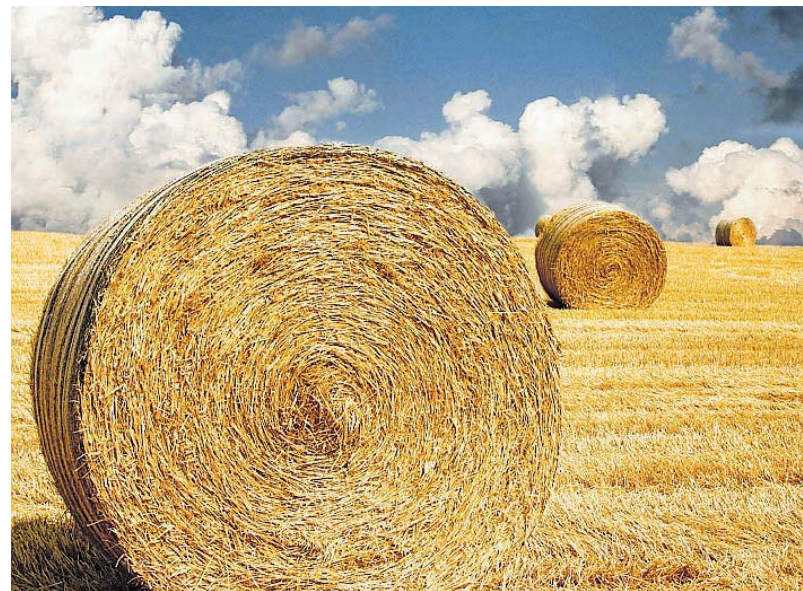
Erntezeit war im Juli für Wolfgang Ballof.