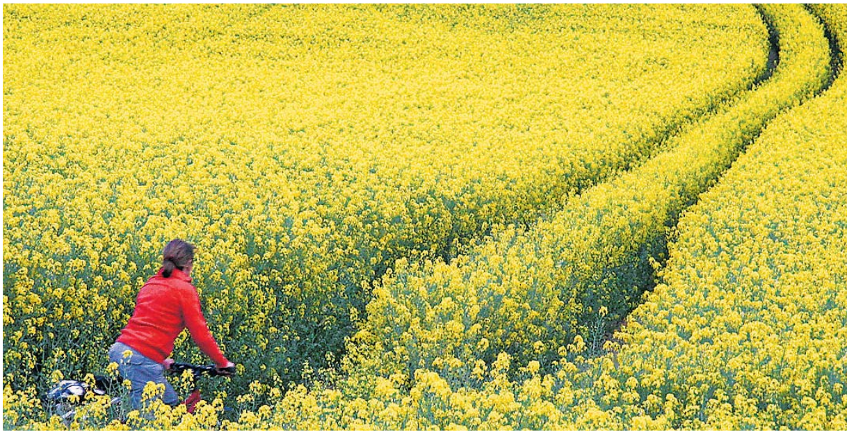
Die Radfahrerin im Rapsfeld von Alexander Schmidt kam im Mai auf Platz eins.

Leser wählen das Foto des Jahres! Die Hobbyfotografen des Fotoclubs Tele Freisen schicken das ganze Jahr über ihre gelungensten Schnappschüsse an die St. Wendeler Lokalredaktion, die dann jeweils ein Foto des Monats auswählt. Nun wird ein Jahressieger ermittelt.