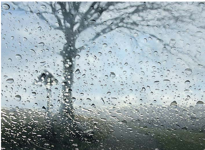
Das Foto des Monats Februar kam von Wolfgang Ballof.