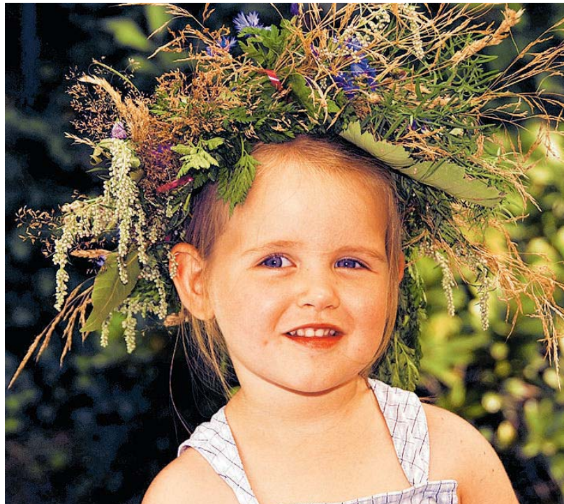
Auch Porträt-Fotografie lehrt der Fotoclub.

Der Fotoclub Tele Freisen bietet erneut einen Grundlehrgang für Hobby-Fotografen an