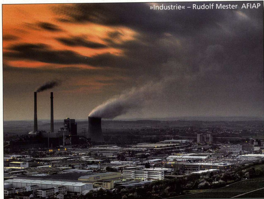
»Industrie« – Rudolf Mester AFIAP

Herzlichen Glückwunsch an alle erfolgreichen Kandidaten!