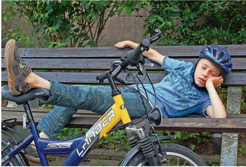
PRODUKTION DIESER SEITE: MELANIE MAI DAGOBERT SCHMIDT

Bild des Monats August Das ganze Jahr über wählt die Jury der SZ-Redaktion St. Wendel aus den Bildern des Fotoclubs Tele Freisen das jeweilige „Bild des Monats“. Das Motto gibt die SZ dabei vor. Im August lautete es „Pause“.