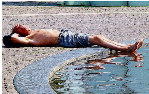
Platz sieben: „Kühles Nass“ von Ingrid Neu aus Niederlinxweiler.