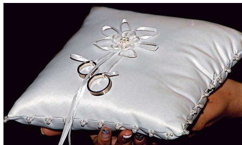
Platz zehn: „Besiegelt“ von Wolfgang Ballof aus Niederkirchen.