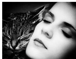
Platz fünf: „Geliebte Emma“ heißt das Bild von Dieter Kremp aus Hoof.