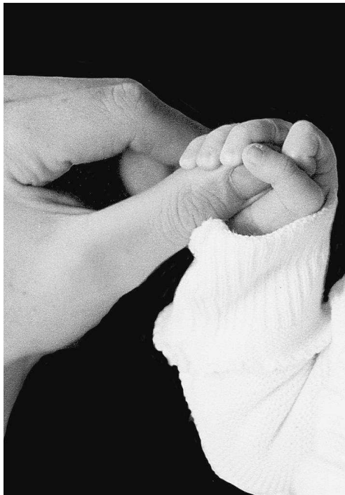
Platz zwei: „Vater und Sohn“ ist der Titel dieses sehr emotionalen Fotos von Clemens Arntz aus Furschweiler. FOTOS: TELE

Freisener Fotoclub reicht zahlreiche Bilder ein