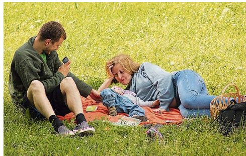
Platz drei: „Timo, unser Bund des Lebens“ von Karola Maurer, Freisen.

PRODUKTION DIESER SEITE: MELANIE MAI DAGOBERT SCHMIDT